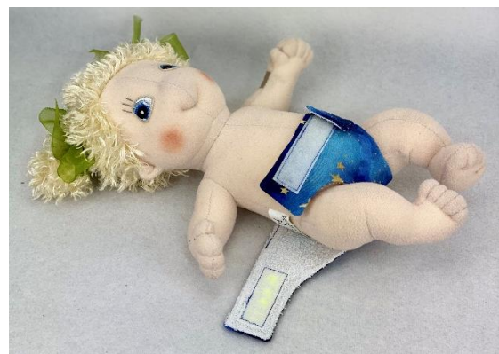
Rubens Cutie (32 cm) visar tygblöja.