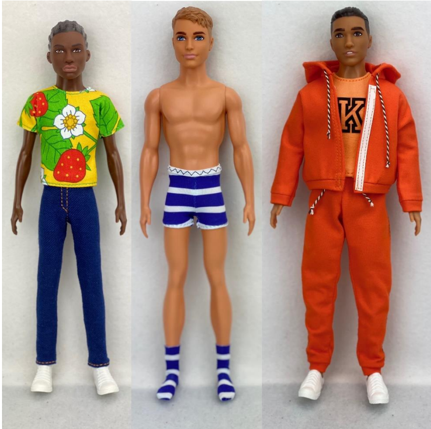
Bild: Slim, Original och Broad Ken med kläder från mönstersamling nr 36.