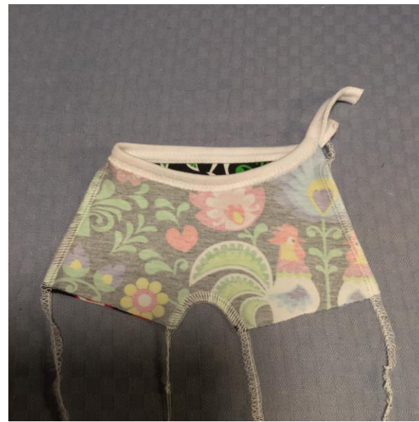
7. Sy ihop andra sidesömmen.