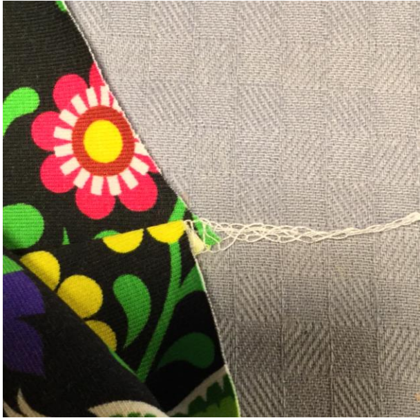
5. Jämna till vid midjan.