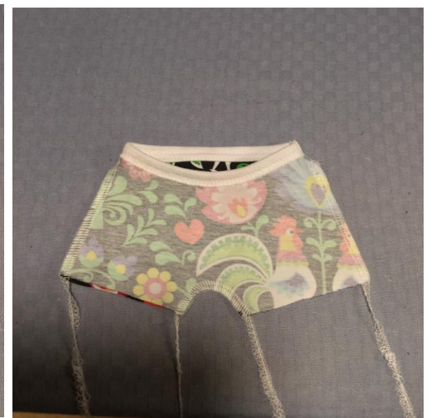
8. Sy ihop och sy ner kantbandet/vikresåren (mer detaljerad beskrivning finns i sömnadsbeskrivningen för tröjan).