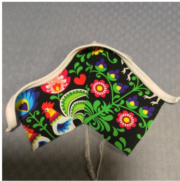
6. Bandkanta eller sy på vikresår i midjan.