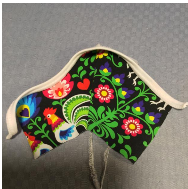
6. Bandkanta eller sy på vikresår i midjan.