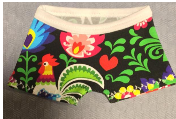
11. Färdig kalsong!