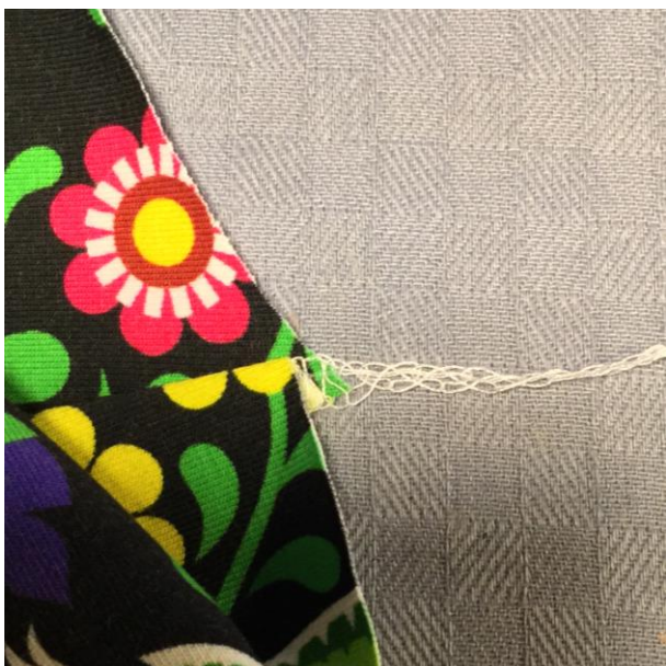
5. Jämna till vid midjan.