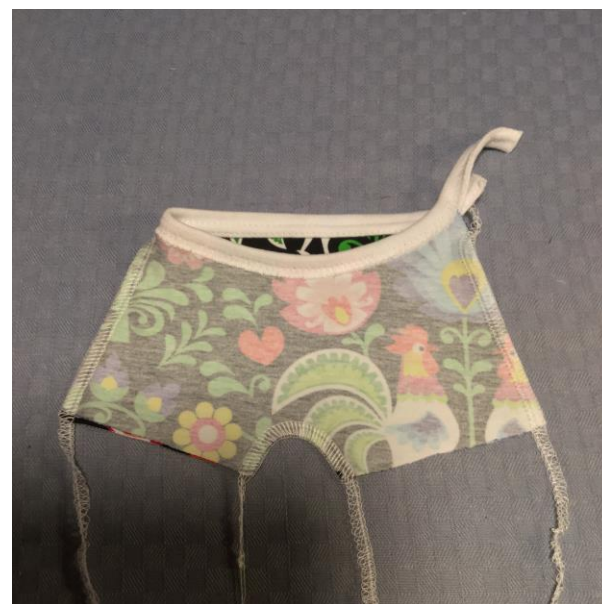
7. Sy ihop andra sidesömmen.