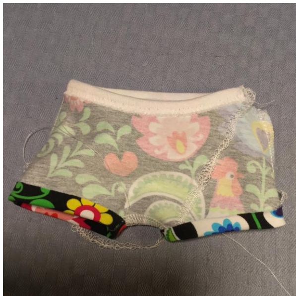
9. Vik upp benfållarna.